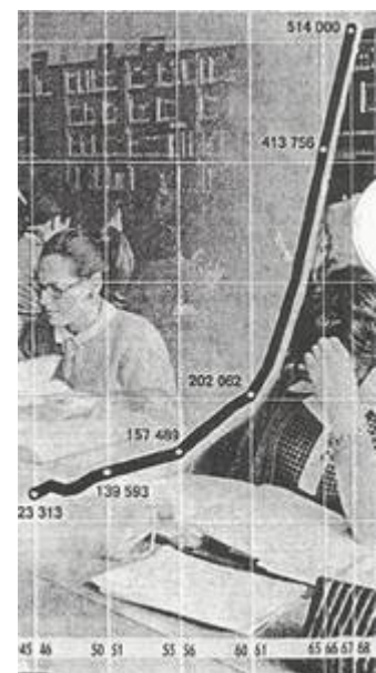
LES ÉTUDIANTS FRANÇAIS DE 1945 À 1968.

Cette contestation-là, c'est à peine si elle s'ébauche, dans un monde étudiant désorganisé, ces dernières années, par la crise de l'U.N.E.F., la crise de l'U.E.C. (Union des étudiants communistes). Au lendemain de la guerre d'Algérie, les étudiants français, comme les adultes, se sont endormis dans le