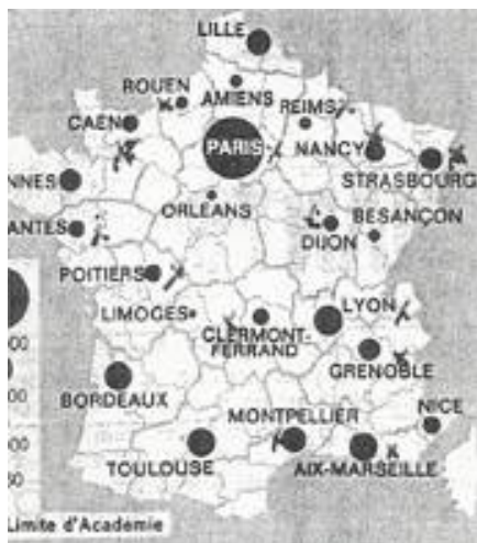
LES 23 VILLES ACADÉMIQUES.

Les lois de la nature. Huit jours plus tard, le 22, février, le ministre de l'Education nationale, M. Alain Peyrefitte, répond. Devant le Copar (Comité parisien des œuvres universitaires et scolaires), il présente les grandes lignes d'un nouveau règlement. « Désinvolture et hypocrisie », commente, le lendemain, le bureau (national de l'U.N.E.F.