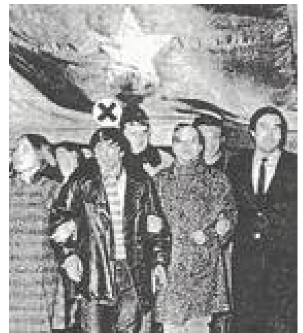
FRANCFORT : RUDI DUTSCHKE (X)

C'est par le dosage de ces trois composantes que se différencient les mouvements étudiants des divers pays. En Italie, les manifestations, si violentes soient-elles, marquent essentiel-