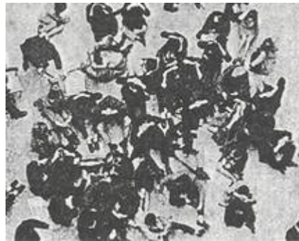
MILAN : LES ÉTUDIANTS OCCUPENT LA COUR DE L'UNIVERSITÉ. Sortir du simple refus.

En France, la situation est à mi-chemin entre l'Italie et l'Allemagne. Pour une bonne partie des étudiants, les revendications ne dépassent pas le cadre de l'Université ; elles concernent leur mode de vie en résidence, leurs difficultés de travail en faculté. Mais pour ceux qui suivent le Bureau de l'U.N.E.F., elles débouchent, comme en Allemagne, sur une contestation de la société. La lutte dans les campus n'est qu'un premier épisode, le thème de mobilisation actuellement privilégié. Le mouvement s'apaisera peut-être pendant le troisième trimestre, à cause de l'échéance des examens. Mais les étudiants pensent déjà à la prochaine rentrée, qui menace d'être encore plus difficile que la précédente. Et qui donnera la matière à de nouvelles actions.