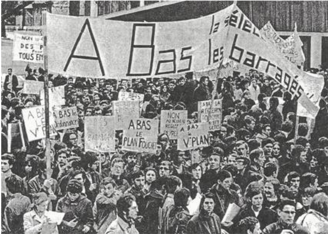
LA MANIFESTATION DE JEUDI DERNIER A PARIS. « Ce n'est pas une faculté, c'est une caserne. »